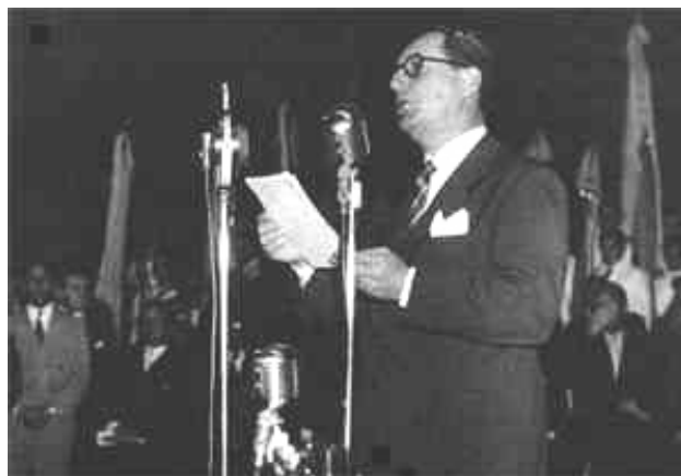
PERON PRESENTANDO "LA COMUNIDAD ORGANIZADA"

la Nación, General Juan Domingo Perón, clausuró el Primer Congreso Nacional de Filosofía con una conferencia inmortalizada en un libro que lleva como título: "La Comunidad Organizada".