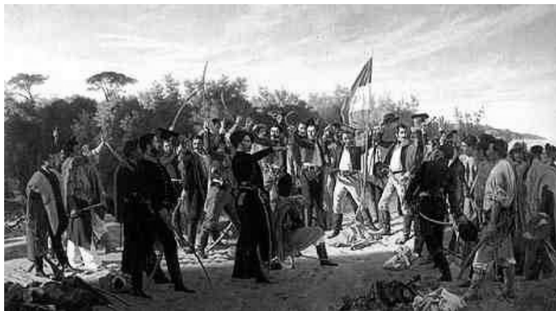
Juramento de los Treinta y Tres Orientales

E I pensamiento de estos hombres no era otro, que anexar al Uruguay con Argentina, el 24 desde el pueblo de Soriano, Lavalleja lanzó su proclama “ LAS P R O V I N C I A S HERMANAS SOLO ESPERAN VUESTRO PRONUNCIAMIENT O P A R A PROTEGEROS EN LA HEROICA E M P R E S A D E