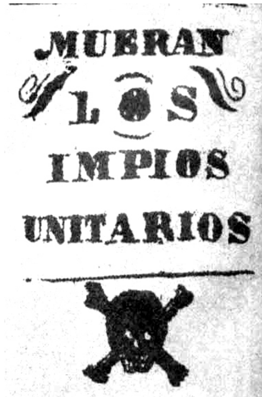
Propaganda Federal de la Epoca

Otra felonía histórica, conocida por pocos, pero que se hace un deber de PERÓN ...Vence al Tiempo, hacerla conocer.