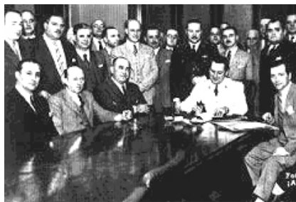
Perón firma Convenio Salarial con Industria Grafica