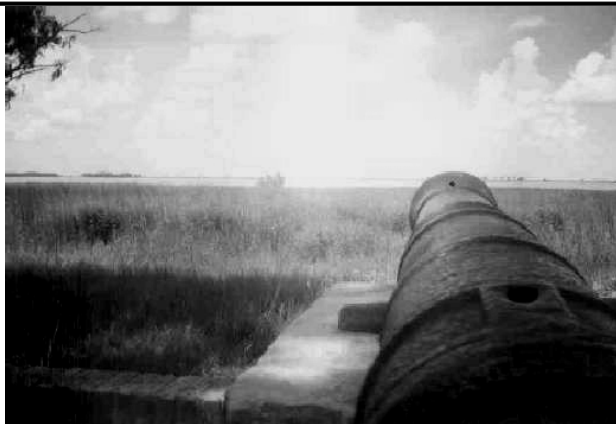
Foto actual de uno de los cañones en la Vuelta de Obligado

Después de ocho horas de bombardeo incesante, los patriotas se quedan