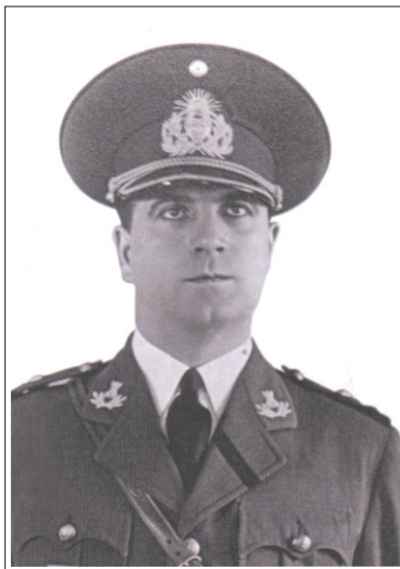
Gral. Juan José Valle

Los 33 Compañeros fusilados, son recordados todos los años por los mismos de siempre, sus familiares y sus compañeros de mil batallas de la Resistencia Peronista, casi en silencio, rindiendo los honores a los que mueren