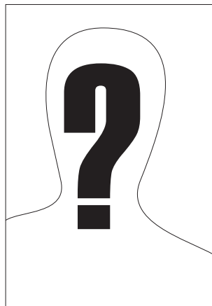
José Luis Torres, un maldito más de la Historia Oficial. De él no se encuentran imágenes

mente bárbaros a pesar de su cultura, que impera todavía en el mundo la ley de la selva, salen de la Universidad considerándolo así, como sale la fiera de su cubil en busca de la pitanza, a la cual no le hace ascos, donde quiera que la encuentre. Los títulos universitarios sirven a muchos a modo de patente para la explotación comercial de una actividad exclusivamente egoísta. Muy pocos son los jóvenes argentinos egresados de la Universidad y dedicados después con toda su sapiencia universitaria, al servicio de un ideal, o más modestamente todavía (ya que el ideal no acaricia sino a los elegidos), al simple cumplimiento de un deber. La gran mayoría, con su título debajo del brazo, corre a buscar la protección interesada del político influyente, siempre dispuesto a envilecer a los demás después de haberse él mismo envilecido; procurando así abrirse, a los sometimientos prematuros, pero ya definitivos, las puertas de la burocracia, refugio amable para los hombres de flacas energías y cortos pensamientos