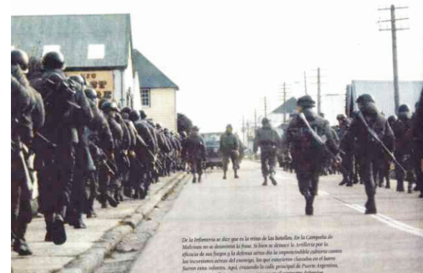
Tropas Argentinas marchando en "Puerto Argentino"

Pues allí, circundadas por espuma revuelta, LAS MALVINAS esperan, esperan nuestra vuelta. Y tu corte de manga nos señalará el camino Que nos lleve otra vez hasta PUERTO ARGENTINO.