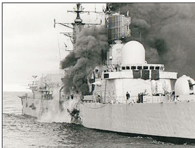
Impacto del misil Exocet en el Destructor "Sheffield"

El "exocet" cumplió su cometido. Y la Royal Navy puede dar un buen testimonio de ello.