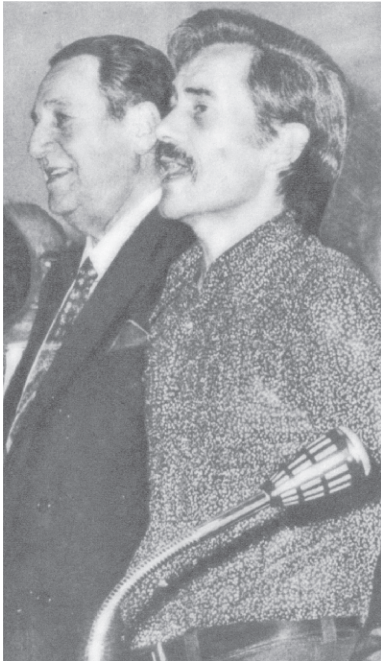
“ Nos negamos a seguir mirando, impasibles, el rostro marchito de la Patria” José Ignacio Rucci Diciembre de 1972

Descubrir en el espectro sindical nacional actual ejemplos de sentimientos profundamente nacionales como el de José Ignacio Rucci es una tarea posiblemente con difícil desenlace feliz.