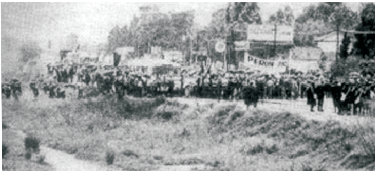
Marcha del pueblo, el 17 de Noviembre de 1972, al encuentro con el Líder

M ire si tenemos fechas lo peronistas para recordar. Todas son el fruto de diversas luchas que Perón vino a plantear por estos pagos.